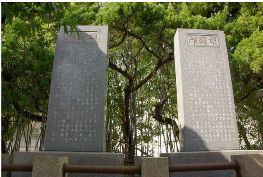
金子直吉頌徳碑（右）、柳田富士松頌徳碑（左）