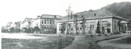
神戸高等商業学校