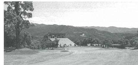
愛媛ゴルフ倶楽部（昭和50年～）