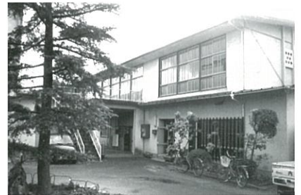
旧内子中央公民館（昭和36年～平成15年）