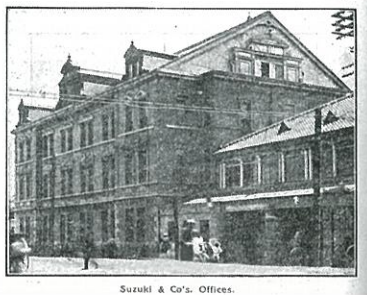
Suzuki & Co's. Offices. 鈴木商店本店