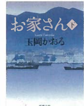
【第25回織田作之助賞受賞作】

日程＝平成26年2月21日（金）14:00/19:00／22日（土）11:00/16:00／23日（日）11:00/16:00（全6公演）